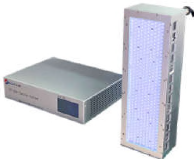
Рисунок 3. Облучатель поверхностного типа HL-AC-A03