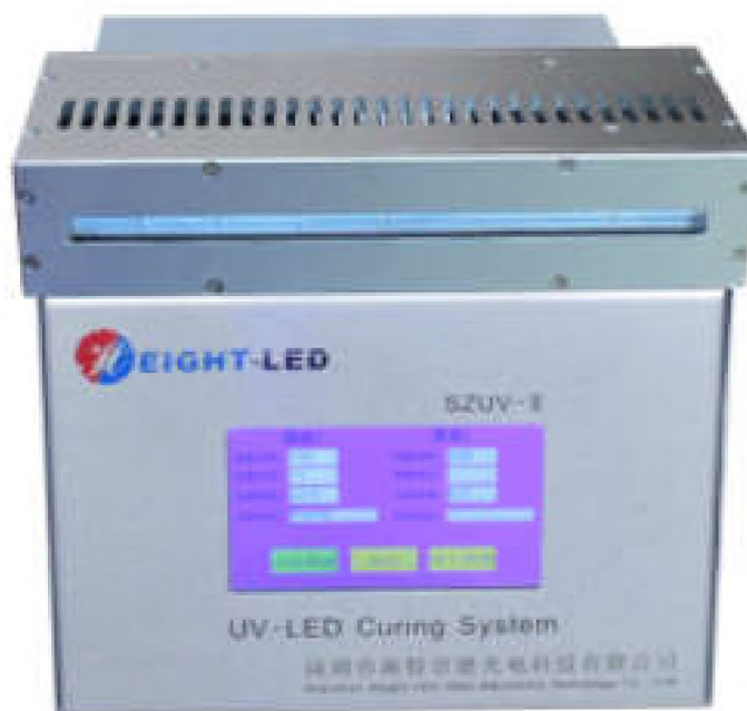
Рисунок 2. Облучатель линейного типа HL-AC-A02