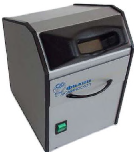
Рисунок 4. Облучательная установка «Филин LED люминоскоп»