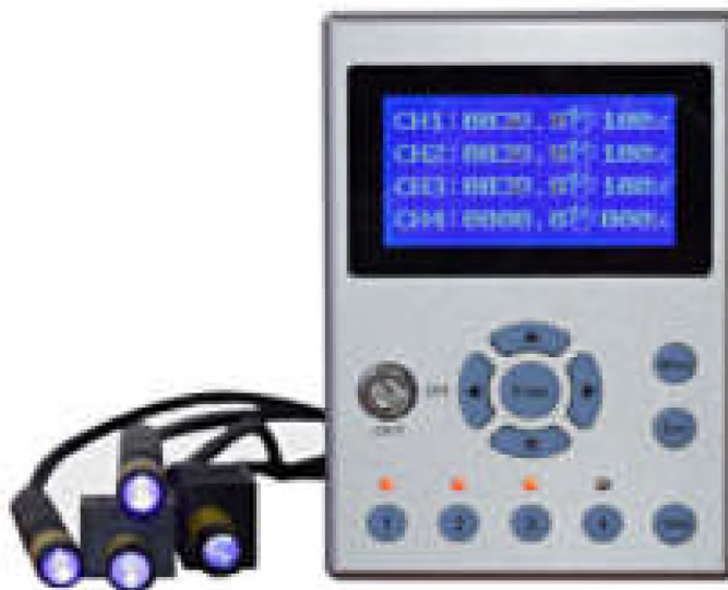
Рисунок 1. Облучатель точечного типа HL-AC-A01

Промышленностью выпускаются УФоблучатели точечного, линейного и поверхностного типа (рисунки 1 – 3) [2]. Параметры СД облучателей точечного, линейного и поверхностного типа производства китайской компании Hight-LED представлены в таблице 1 [2]. Данные облучатели нашли широкое применение в УФ сушке лакокрасочных покрытий.